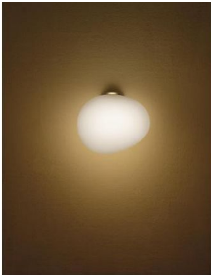
Available Versions Erhältliche Ausführungen